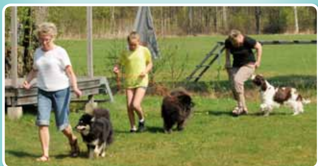
Så här såg det ut förra året på Hundens Dag.