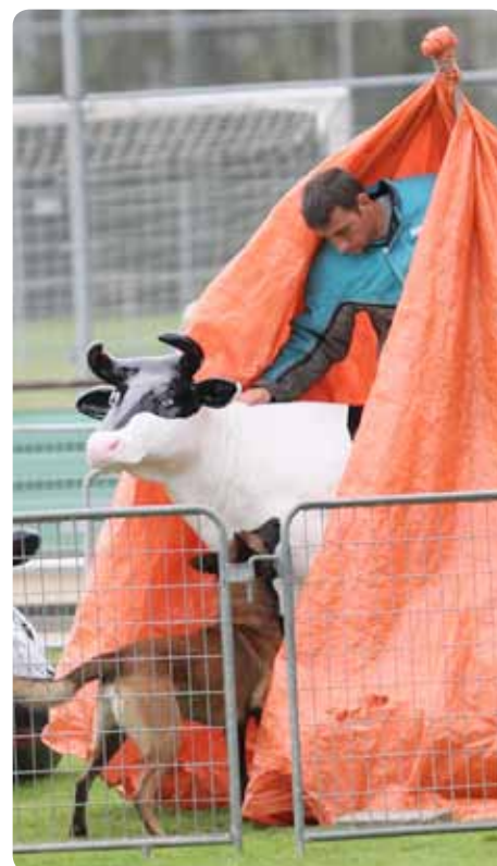
Sökmomentet kan se ut t ex så här. Frost van de Biezenhoeve.

Tävlingsplanen i Mondioring är väldigt olik de planer som vi är vana vid i Sverige. Planen ska vara inhägnad och på planen kan finnas en massa olika saker, t.ex. tunnor, tält, halmbalar, plastmurar, konor, vattenbassänger, torkställningar, gömslen, m.m. När man går in på planen måste man lämna ifrån sig koppel och halsband till provledaren. Generellt är det så att endast ett kommando är tillåtet, extra kommandon ger oftast betyget noll.