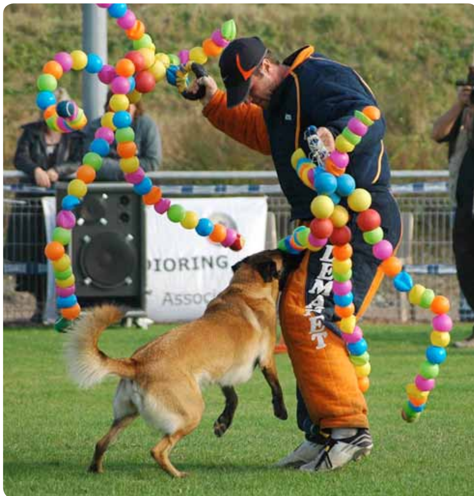
Momentet frontalangrepp med tillbehör. Blackneck's Xa.

Mondioring består av lydnad, hopp och skydd. När man tävlar så gör man hela programmet i en följd utan pauser. Det finns tre klasser: MR 1, MR 2 och MR 3. I klass 3 tar programmet ca 45 minuter att genomföra, det vill säga att man är inne och jobbar med hunden i tre kvart utan några längre uppehåll. Programmet börjar alltid med lydnamnsmomenten följda av hoppmomenten och sist skyddsmomenten. Ordningens följd för de olika lydnamns-, hopp- och skyddsmomenten lottas innan varje tävling. Momentordningen är alltid lika för samtliga tävlande med undantag av fasttagande och återkallande som lottas individuellt när man kommer in på tävlingsplanen. Utförandet av de olika momenten varierar från tävling till tävling. I början av varje tävling och klass går en provhund som visar hur momenten ska utföras under den aktuella tävlingen.