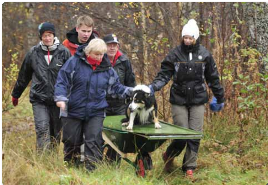
Delar av sökgänget på väg tillbaka efter att ha tränat dolda legor vid klubben.

dag som även den hade lagats av Mållan. Alla var mycket nöjda med dagen och en del, liksom jag, hade provat på något helt nytt. Efter den sena fredagskvällen och hela lördagen med hundträning var jag rätt mör och det blev en tidig sorti för min del. Jag bestämde mig för fortsatt sökträning på söndagen och det var lika kul som dagen innan. Efter det passet samlades vi och käkade gemensam lunch. Därefter började folk droppa av undan för undan medans vi var några tappra som körde ett sista lydnadspass