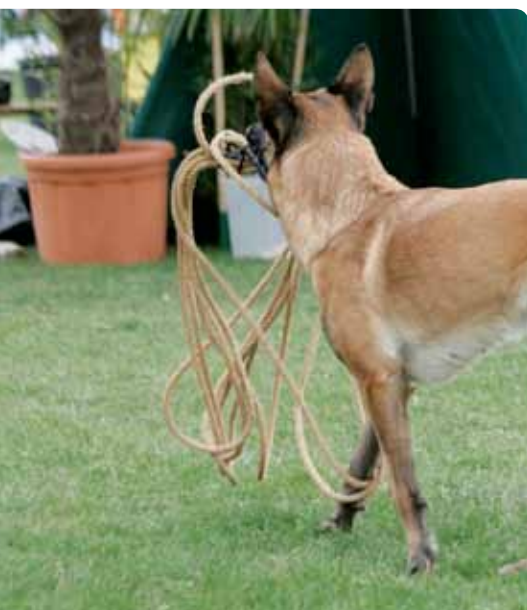
Nedan: Apporteringsföremålen kan se ut nästan hur som helst. Blackneck's Xa.