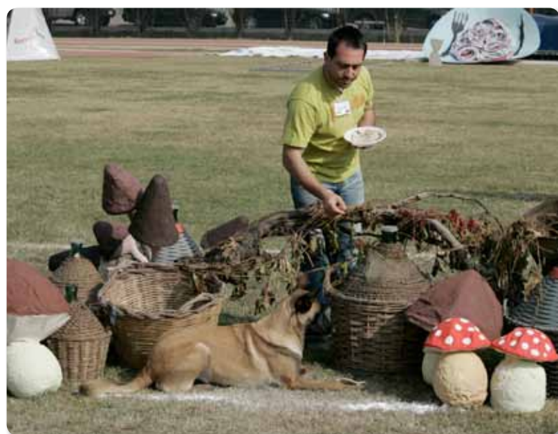
"Matvägran". Blackneck's Xa.

Maximal poängsumma är i MR 1 är 200 poäng, i MR 2: 300 po- äng och i MR 3: 400 poäng. För uppflyttning till klass 2 & 3 krävs 2*80% av maxpoängen. Precis som i svensk bruket finns bestämda avdrag för olika "fel".