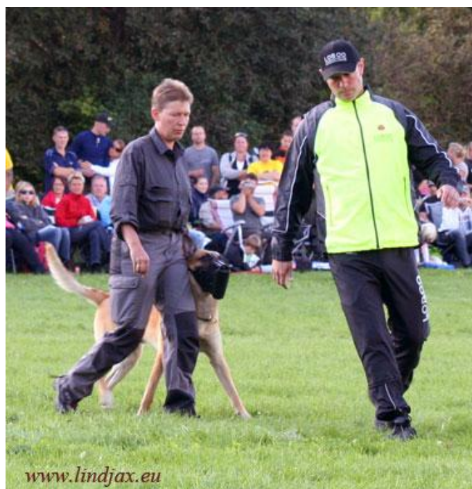
SM Skydd 2008

Jag kan också berätta för er som inte var där att det var VARMT! Morsan trivdes superbra! Jag har i och för sig inte så mycket emot värme men emellanåt blev det lite för bra så att säga. Trots det, och om jag får säga det själv, så tycker jag nog att jag skötte mig RIKTIGT bra på lydigheten. Mamma sa efteråt att det nog var bland de fem bästa lydnadsprogram jag gått på tävling och att om det inte varit SM så hade vi nog fått runt 275 poäng. Det är väl kul.....MEN VILKA VI???? Det är väl jag som gör jobbet, eller?? Sen kom ju skyddet då.....morsan var väl inte riktigt lika imponerad som efter lydnaden..... *sorry* Jag försökte verkligen behärska mig! Men, alltså, liksom, alltså, jag var ju såååå taggad! Så jag tänkte att om jag bara puttar till honom liiiiite så räknas det väl inte som om jag försöker bita fast han står still....?? Eller gör det det? Jag förstod att det blev en del nerdrag på betygen i alla fall.... I vilket fall tog kärringen på sig en stor del av missarna och sa att hon nog låtit mig träna för lite och även om vi tappade någon placering är ju en fjärdeplats helt OK.