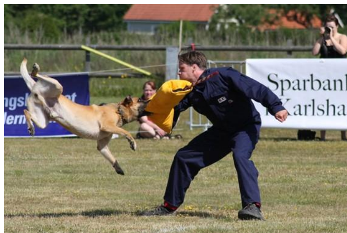
Modprov 2