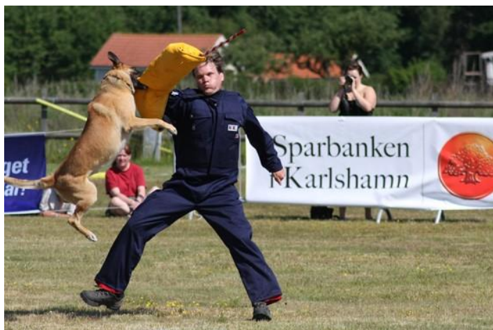
Modprov 1