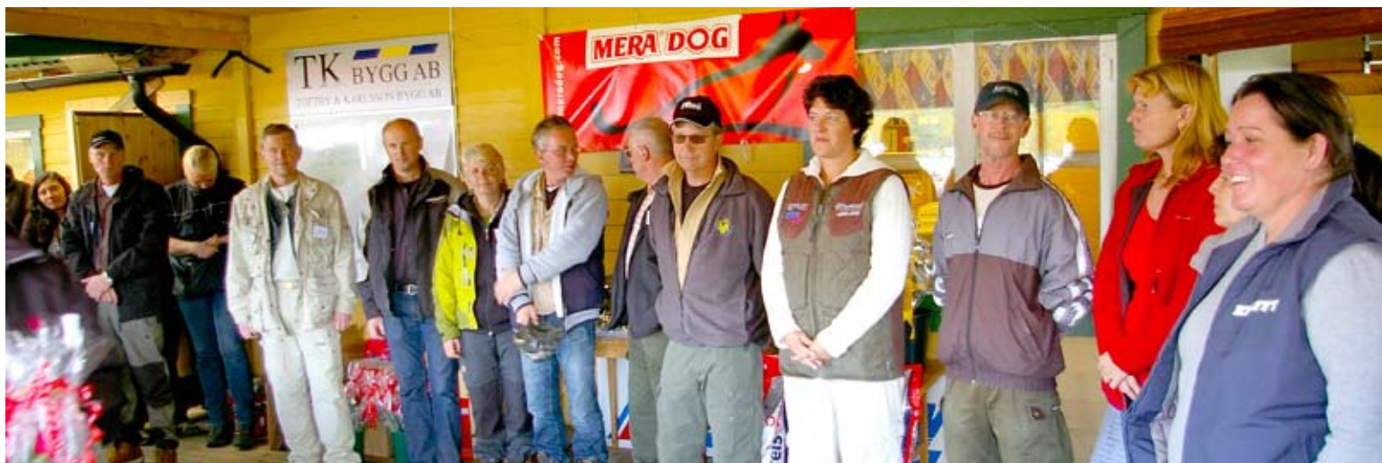
Några av alla funktionärerna under helgen....